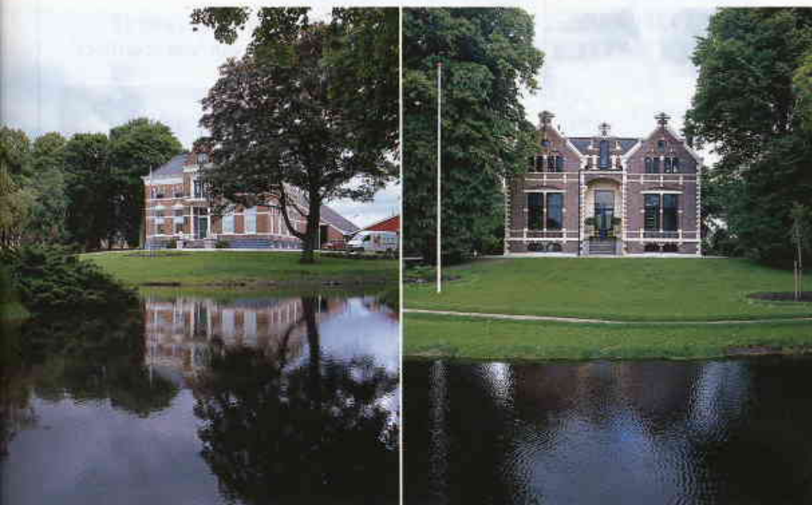
am. Deze naast elkaar gelegen slingeruinen zijn in de tweede helft van de 19e eeuw ontworpen door tuin- en landschaps-

Een overzichtsexpositie van de 'Boerenerven in het Oldambt' is te bezichtigen op 'De Boschplaatse' in Blijham, (0597) 56 12 03.